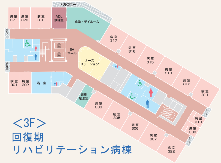
<3F> 回復期 リハビリテーション病棟